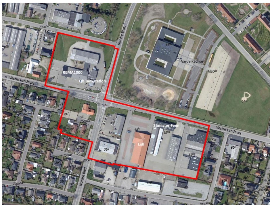
Forslag til geografisk afgrænsning af aflastningsområdet ved Vestre Landevej / Nordre Blvd.

Det foreslås, at aflastningsområdet afgrænses som vist på ovenstående billede, men den endelige afgrænsning og den samlede detailhandelsramme skal fastlægges i den kommende planproces.